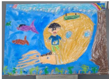
1年生児童 「アンモナイトに乗って ハワイへ行く話」