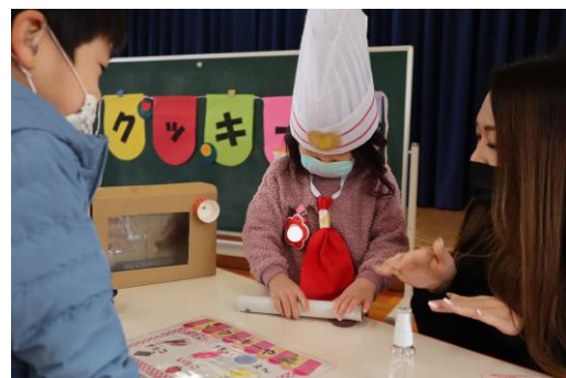
3歳児 おみせやさんごっこ