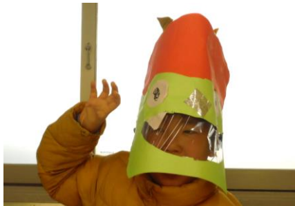
ひまわり1年生児童 「おに」