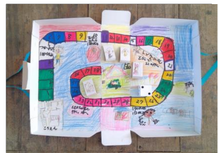
2年生児童 「おかしの家」