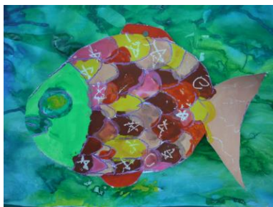
ひまわり3年生 児童 「にじいろのさかな」