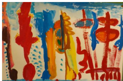
4年生児童 「魔法の花」