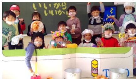
低学年「いいから、いいから」

十一月十九日は、がくげいかいで「いいからいいから」のげきをしました。わたしは、おかあさんたちが見に来てきんちようしました。げきははじまりました。わたしは、せんせいのやくをやりました。ともだちに、「どうぞ。」 と、大きなこえでいえました。ぶたいの下から、おかあさんがビデオをとっていました。わたしは、「じょうずだった？」 と、おかあさんにききました。 「じょうずだったよ。せんせい、かっこよかったよ。」 と、ほめてもらえて、うれしかったです。