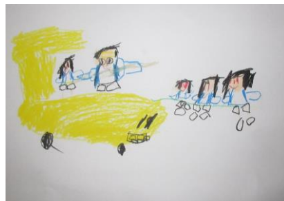
「しゃちに のったよ」