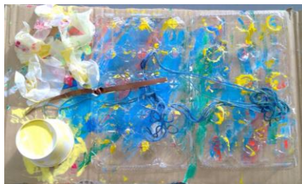
「えきたいねんど」 ひまわり4年生児童