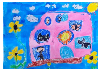
「そらいろの たね」 2年生児童