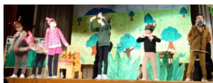
「どうぞのいす」2・4組