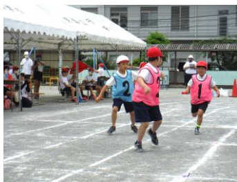
低学年「紅白リレー」

でも、その後、あかぐみにぎやくてんされて、リレーはまけました。くやくして、テントにもどってから、なみだがぼろぼろこぼれまわった。でも、みんなが全力で走ったリレーだったからと思うとなみだがとまりました。かつたり、負けたりしたけれど、運動会はともたのしかったです。来年のリレーはぜったいにかつぞ！