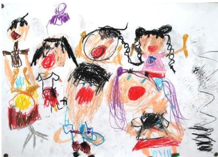
「おもちゃのチャチャチャが たのしかったよ」 5歳児

3さいは「てをたたきましょう」「おたまじゃくしいそう」、4さいは「まねっこドレミ」「かに ピース」、5さいは「おもちゃのチャチャチャ」「さんぽ」のはっぴょうをしました。みんな、とてもすてきてしたよ。