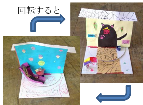
「きれいな町の美しい家」 3年生児童